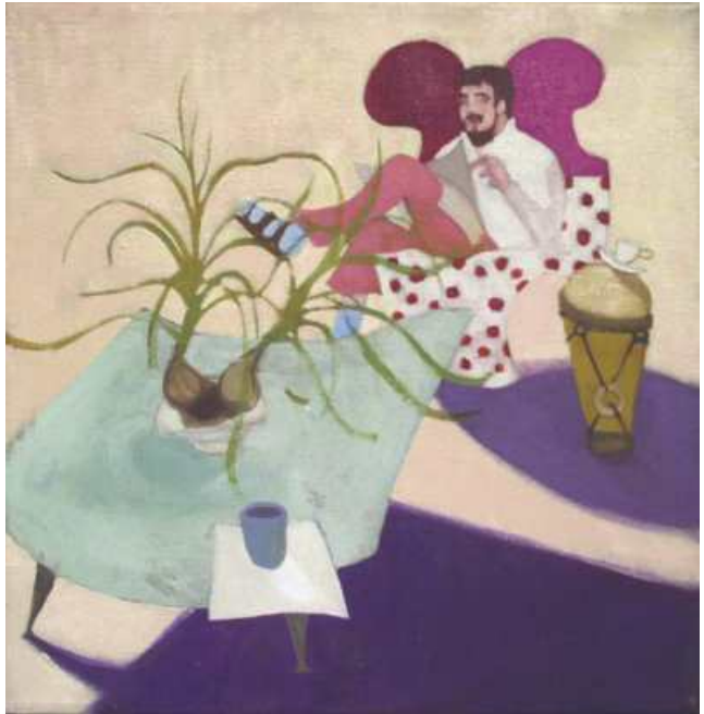
"Vor dem Umzug" (2001) Öl und Tempera auf Leinwand 40 x 40 cm

2005 Kunstverein Kirchzarten, Galerie Schaffrath Viersen 2004 Galerie Zavaletalab/ Buenos Aires Galerie Alexei Russak/ Frankfurt am Main 2003 Künstlerhaus Hooksiel/ Wangerland 2002 Generalkonsulat Rep. Argentinien/ Frankfurt am Main