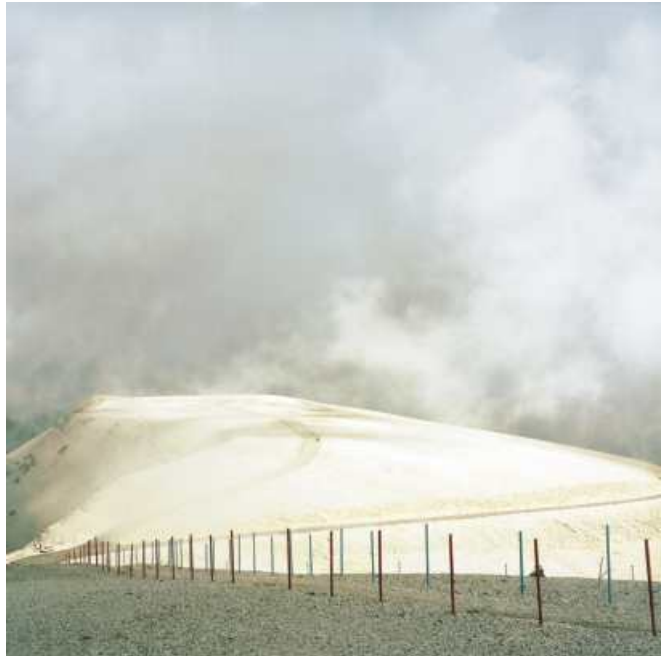
"Hierogamos 13" (2004/05) Lambdaprint/ Aludibond/ Holzrahmen, Auf. 5 Ex., 120 x 120 cm